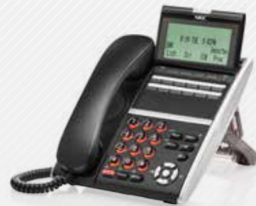
DT430 & DT830