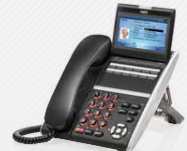
DT830CG Color Display